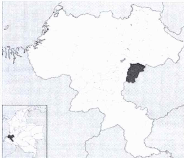
Ubicación Departamento del cauca-Municipio de Puracé

Las coordenadas de las veredas objeto de las obras se presentan en el siguiente cuadro: